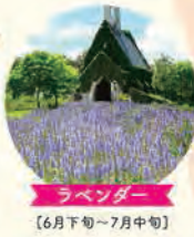
ラベンダー [6月下旬～7月中旬]