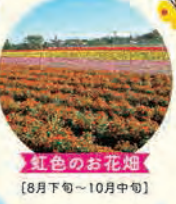
紅色のお花畑 [8月下旬～10月中旬]