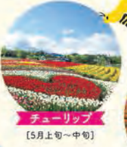
チューリップ [5月上旬～中旬]