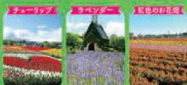
(5月上旬~中旬) (6月下旬~7月中旬) (8月下旬~10月中旬)

大自然の中で楽しみながら学べるワクワク体験は牧歌の里です! 「自然体験DAY」開催! 7/17&8/21